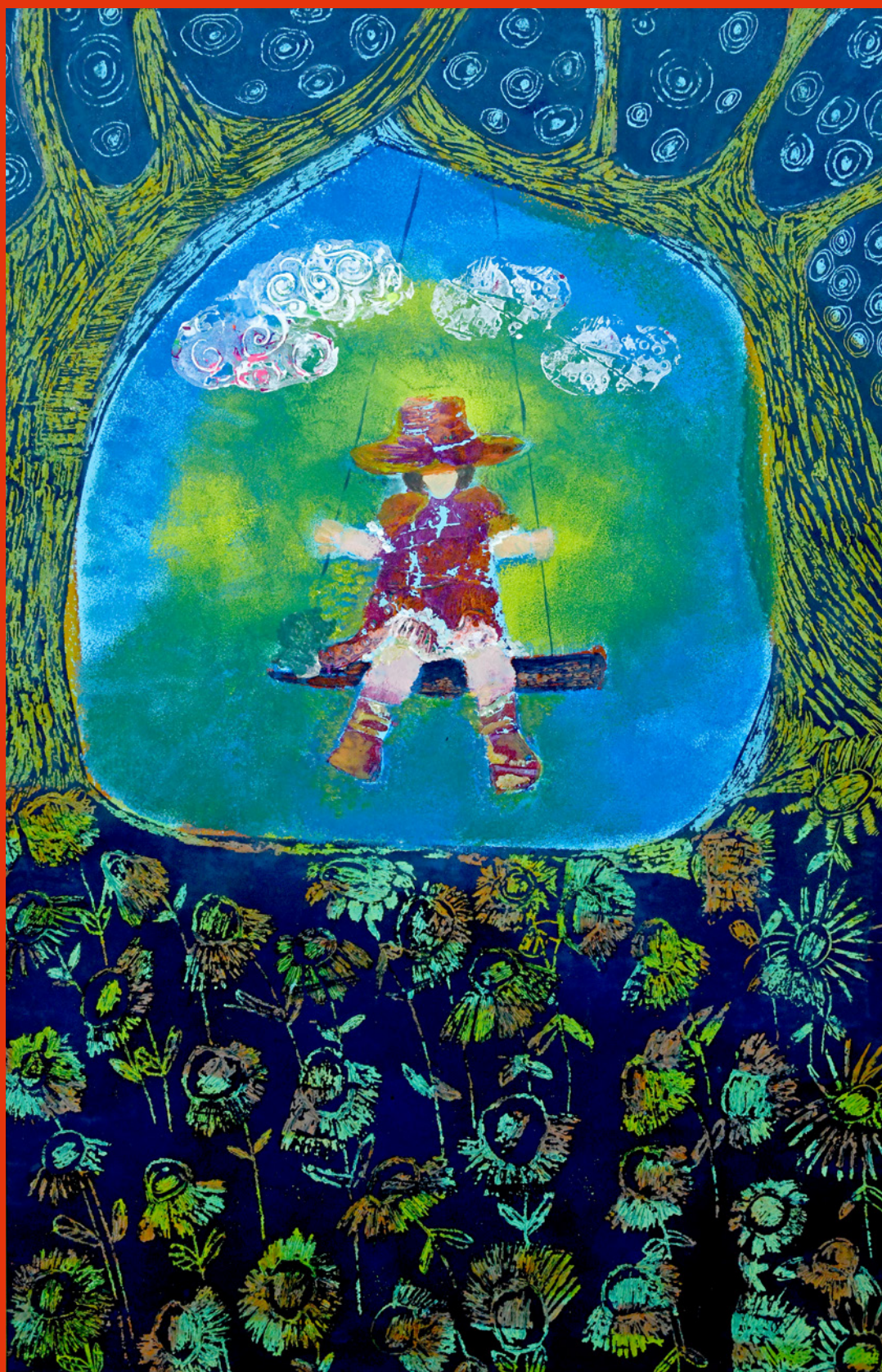
Sabina Dul, Bujać w obłokach