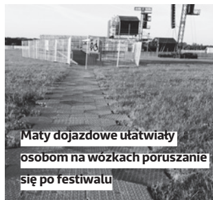
Maty dojazdowe ułatwiały osobom na wózkach poruszanie się po festiwalu

Organizatorzy Open'era kolejny raz pokazali się z najlepszej strony. Świetnie, że dbają o wysoki poziom dostosowania i są rzeczywiście OPEN dla wszystkich gości.