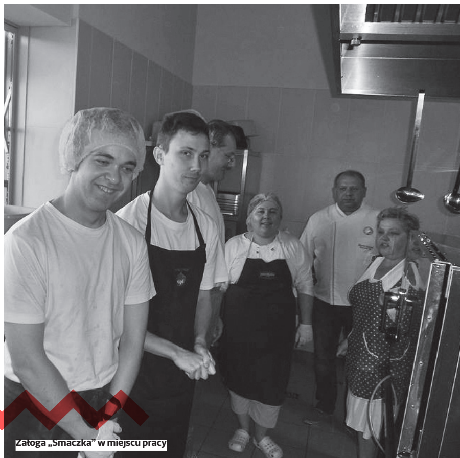
Załoga „Smaczka” w miejscu pracy