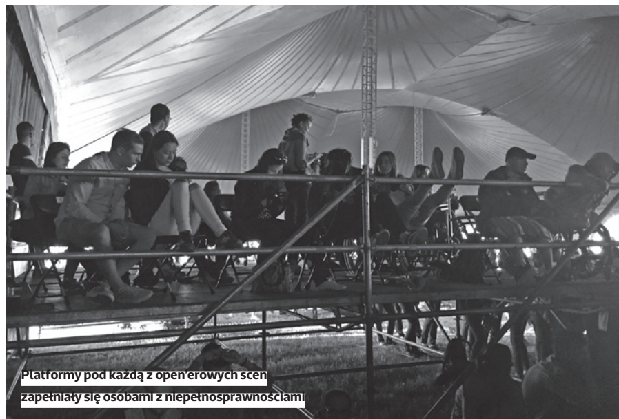
Platformy pod każdą z open'erowych scen zapętniały się osobami z niepełnosprawnościami