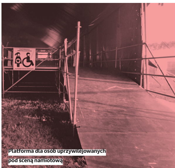
Platforma dla osób uprzywilejowanych pod sceną namiotową