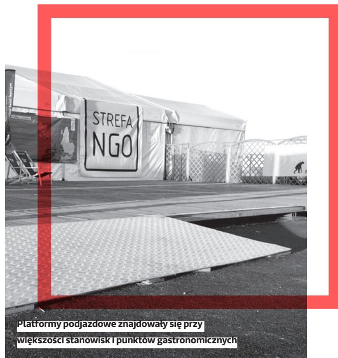
Platformy podjazdowe znajdowały się przy większości stanowisk i punktów gastronomicznych