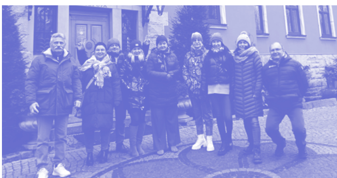
fol. Stowarzyszenie Wielkopolskie WTZ (2)

w poszczególnych WTZ. Wśród członków są bowiem prawnicy, ekonomiści, księgowi, eksperci RODO, specjaliści od zamówień publicznych, a także naukowcy.